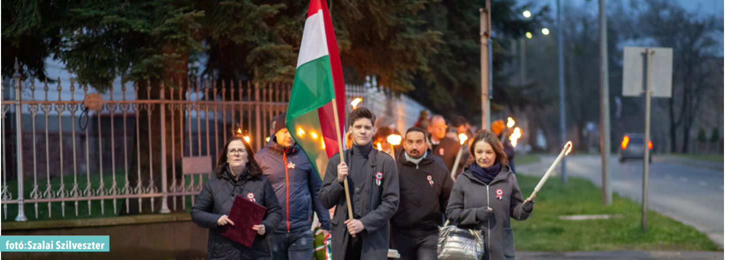
fotó: Szalai Szilveszter

Ünnepi programsorozattal emlékeztek az 1848/49-es forradalom és szabadságharc kitörésére március 15-én Nagykanizsán. Az események 177. évfordulóján több helyen is koszorúzással, valamint emlékezésével hajtottak fejet a magyar nemzet hősei előtt.